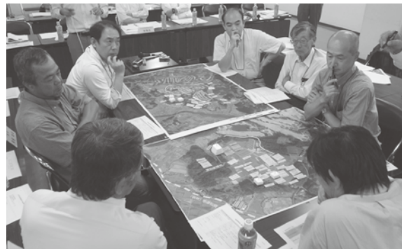
各地域振興策について検討・整理する地域振興策検討委員 (H27.8.30第4回会議)