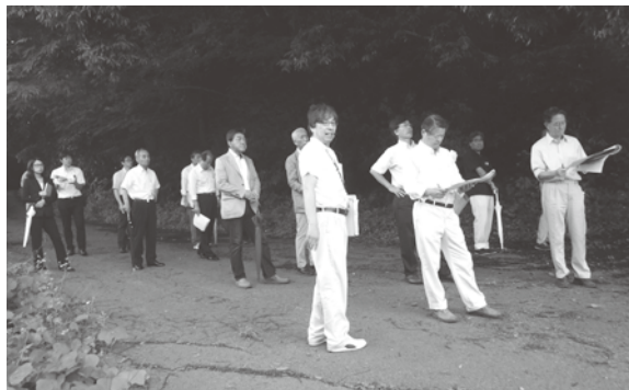
建設候補地を現地調査する施設整備基本計画検討委員 (H27.6.21)