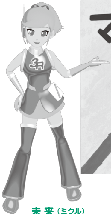
未来(ミクル) 印西クリーンセンター 3Rイメージキャラクター