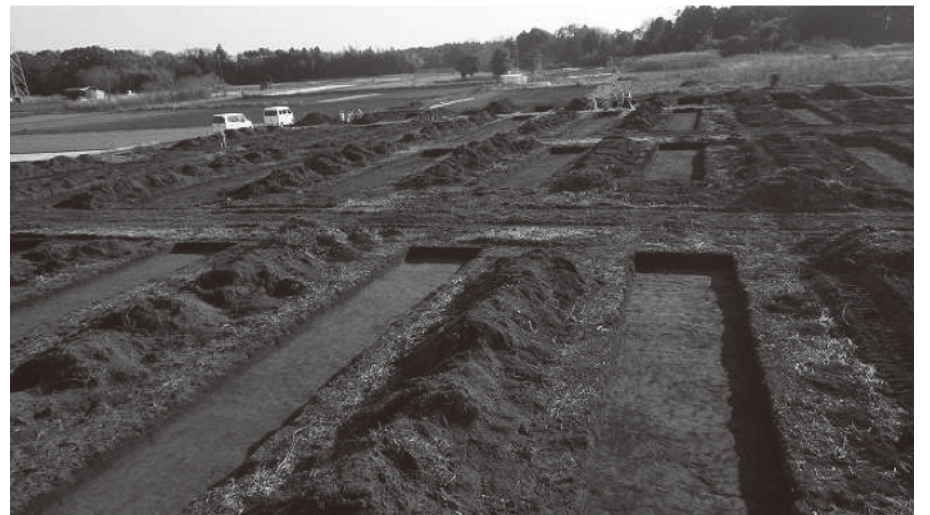
■建設予定地南側の発掘作業の全景（本調査範囲を決定するための確認調査）

令和元年度については、次期中間処理施設建設予定地の埋蔵文化財調査業務（平成30年度からの継続事業）、施設整備基本設計・建設工事発注支援業務、長期責任型運営維持管理発注支援業務、環境影響評価業務、地域振興策基本計画の一部変更業務、地域振興予定地の地盤透水試験業務などを行なっております。