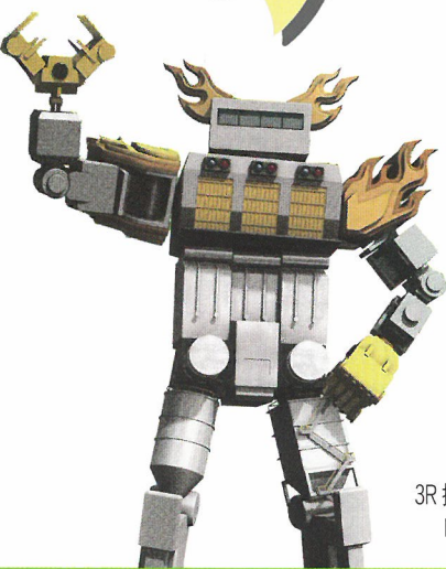
3R推進キャラクター 「Mr.インザイ」