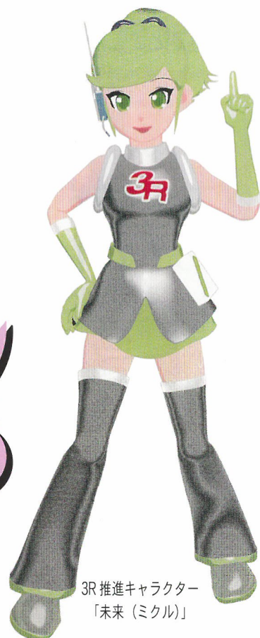
3R推進キャラクター 「未来（ミクル）」

作るおかずを考えてから材料を買えば、「食品ロス」を減らせます。 台所の生ごみの約8割が水分です。水分を絞って出しましょう。 野菜くずや剪定枝は2～3日天日乾燥すれば重量が半分に減ります。 庭や畑に埋めて、土に戻しましょう。