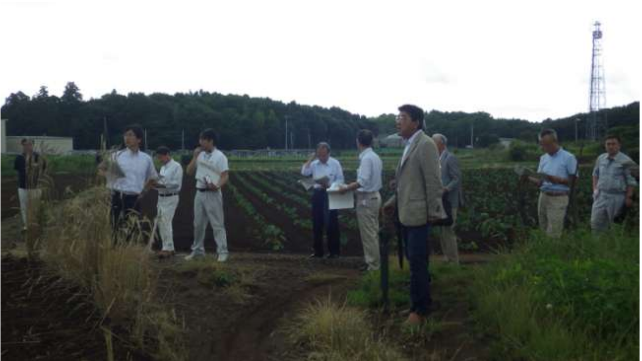
建設候補地南側の敷地境界から現地を確認する施設整備基本計画検討委員