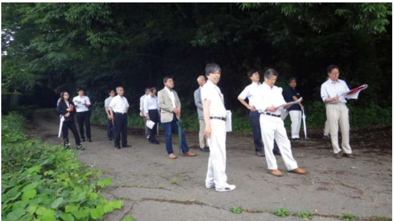
建設候補地北東側から谷津田を確認する施設整備基本計画検討委員