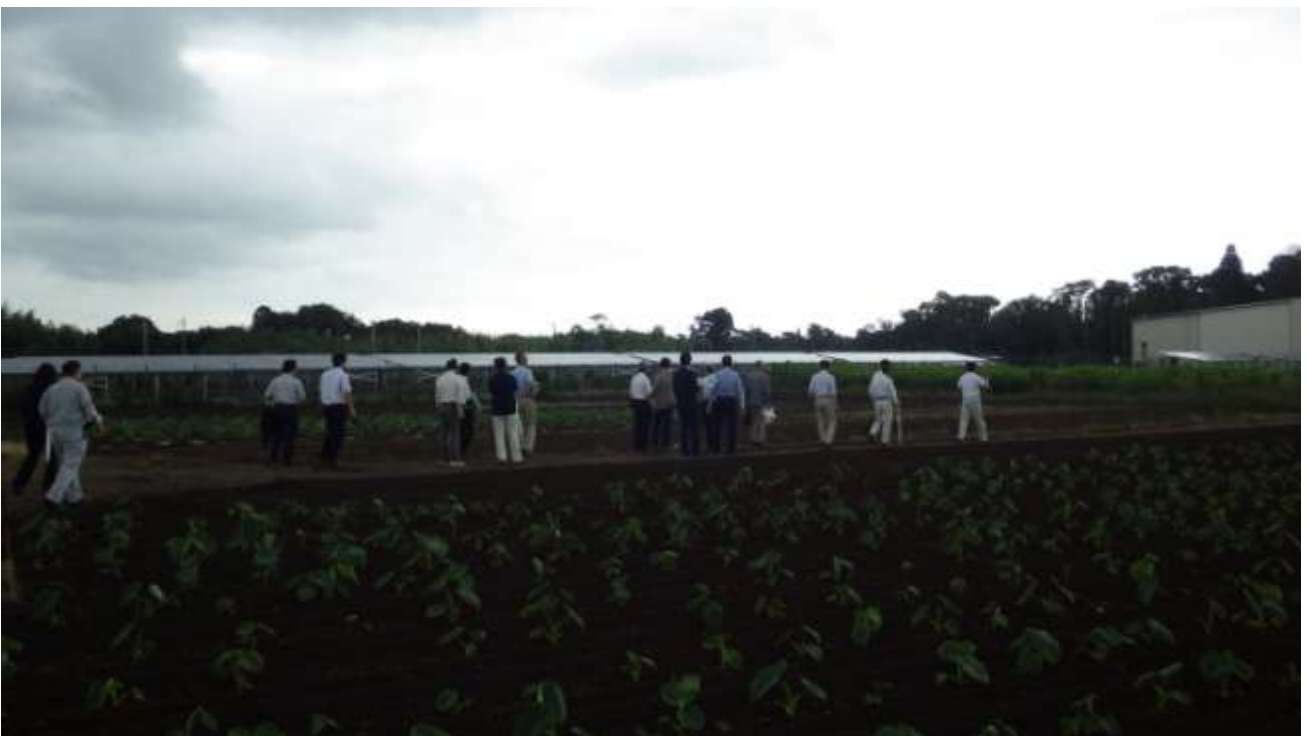
建設候補地東側に隣接する周辺状況を確認する施設整備基本計画検討委員