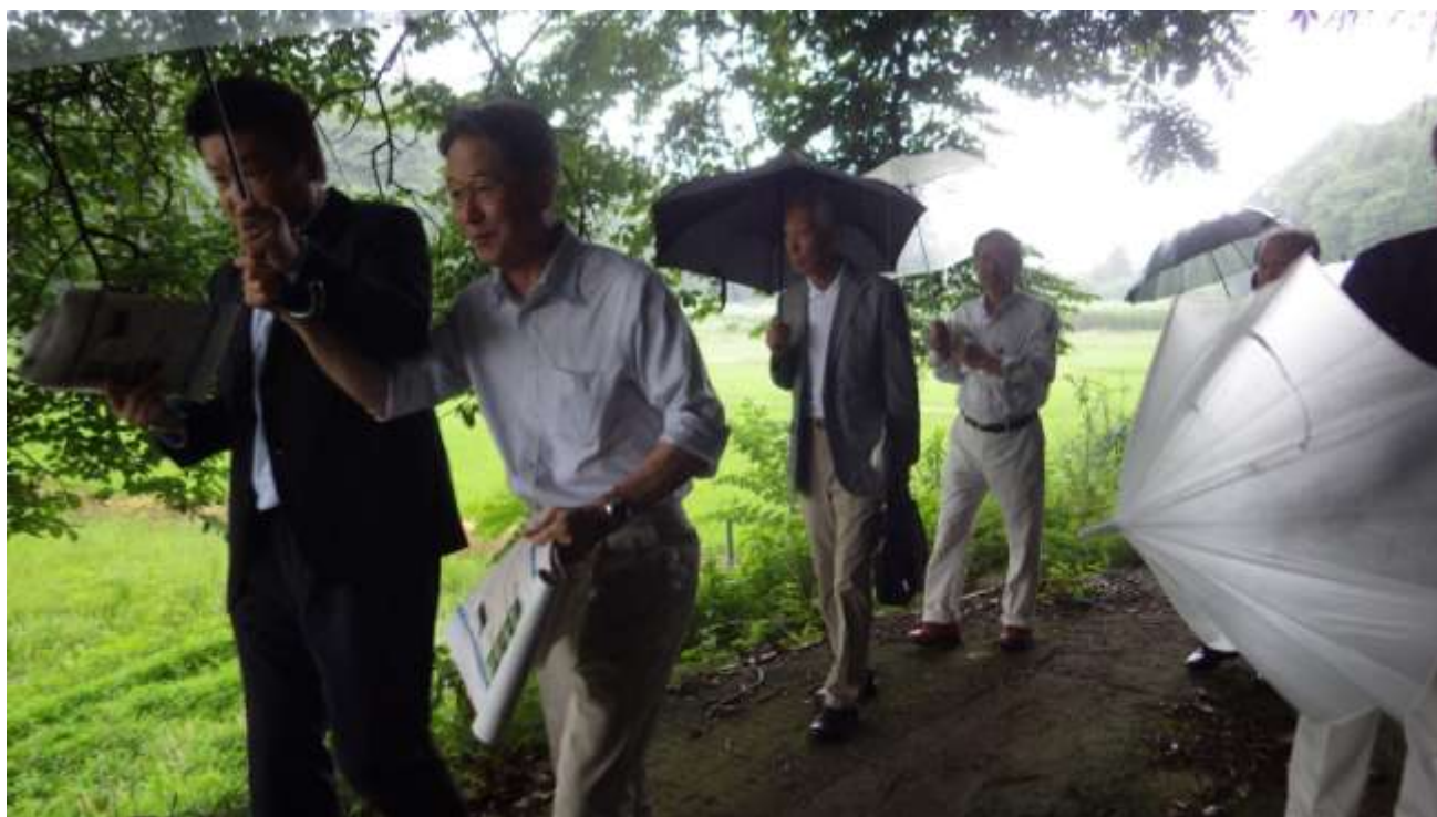
建設候補地北側の谷津田や周辺の斜面林を確認する施設整備基本計画検討委員