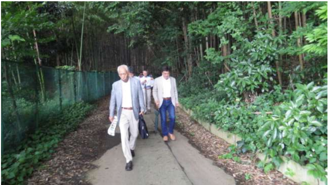
建設候補地東側に位置する周辺施設（泉カントリー倶楽部）や斜面林を確認しながら、北側の谷津田に向かう施設整備基本計画検討委員